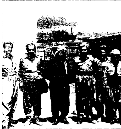
رفاقه بملابس البيشمرکه فی کردستان فی ۱۹۸۴/۷/۲۵